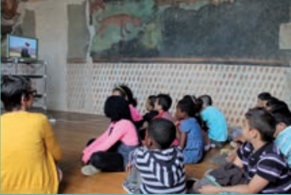
Visite dans la salle des chasses