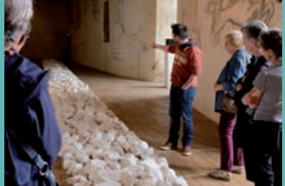
Visite dans la salle d'Hercule (œuvre de Richard Long)