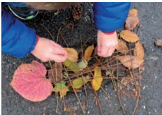
Atelier art et nature

Les propositions sont adaptées à chaque cycle.