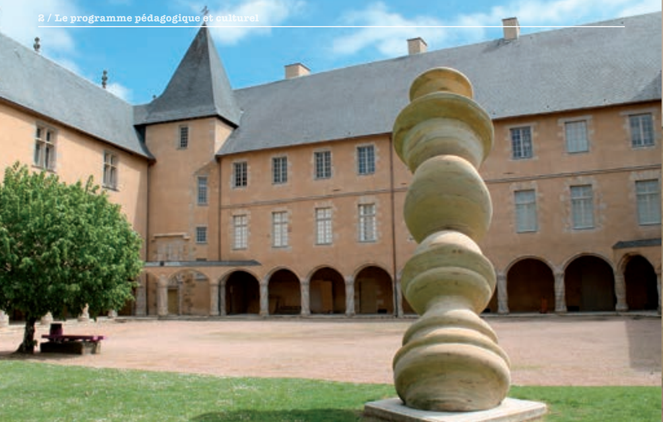
La cour du château avec une œuvre de Tony Cragg, Column , 2001. Dépôt du Musée national d'art moderne (Paris) au Musée départemental d'art contemporain de Rochechouart.

Dès sa création en 1985, le Musée départemental d'art contemporain de Rochechouart a souhaité rapprocher l'art des différents publics grâce à un éventail de propositions :