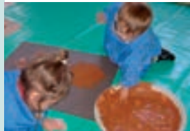
Atelier Petite enfance

Pour chaque exposition, des visites ateliers sont imaginées à destination des groupes de loisirs : le temps privilégié de découverte des œuvres contemporaines est suivi de propositions de manipulations. (Voir page 4).