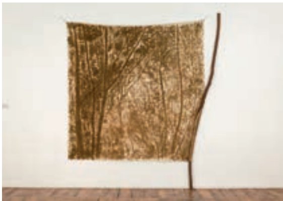
Giuseppe Penone, Il verde del bosco con rami , 1983. Collection MDAC Rochechouart.