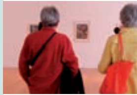
Visite d'exposition Raoul Hausmann