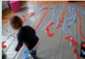
Atelier Petite enfance

Les groupes d'adultes sont accueillis sur rendez-vous pour des visites accompagnées par un médiateur dans les expositions temporaires et permanentes. (Voir page 7).