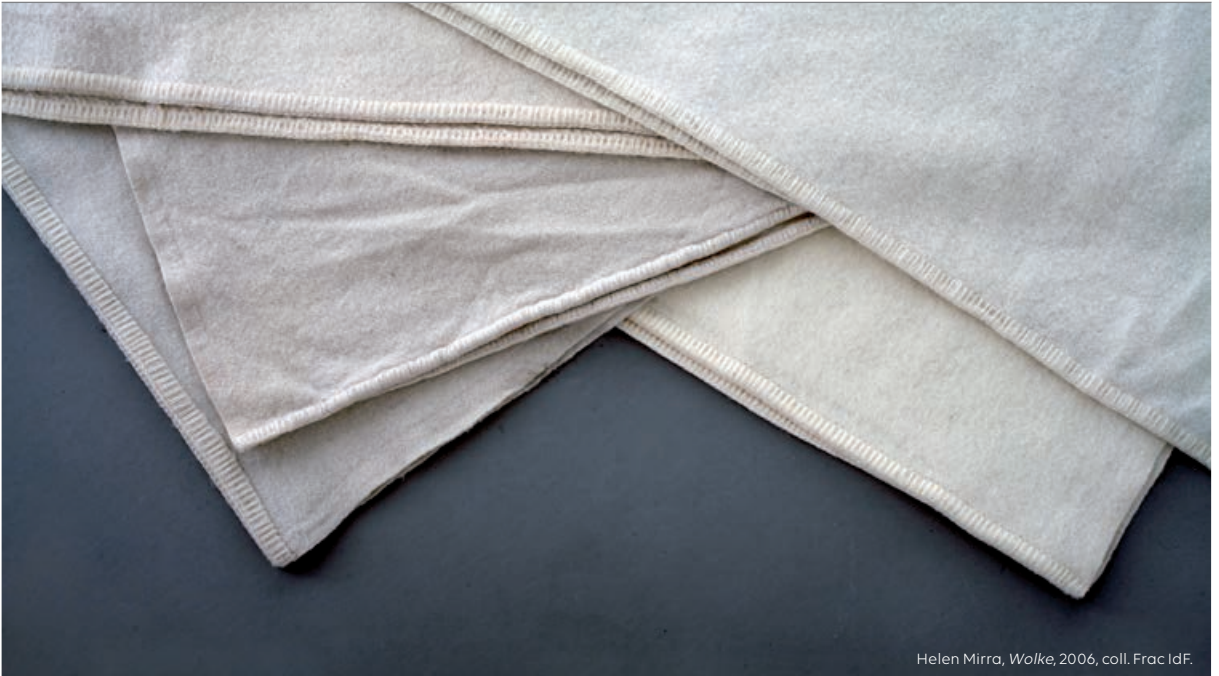
Helen Mirra, Wolke , 2006, coll. Frac IdF.