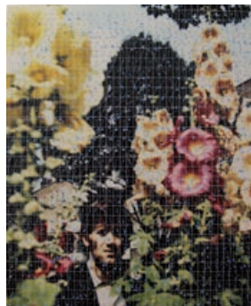
Angus Fairhurst, An Effortless Patch #1, #2, #3, #4 , 1998, coll. Musée d'art contemporain de la Haute-Vienne – château de Rochechouart

paysage sera ainsi le support d'une réflexion sur la mémoire, l'intime, le motif pictural ou encore le documentaire.