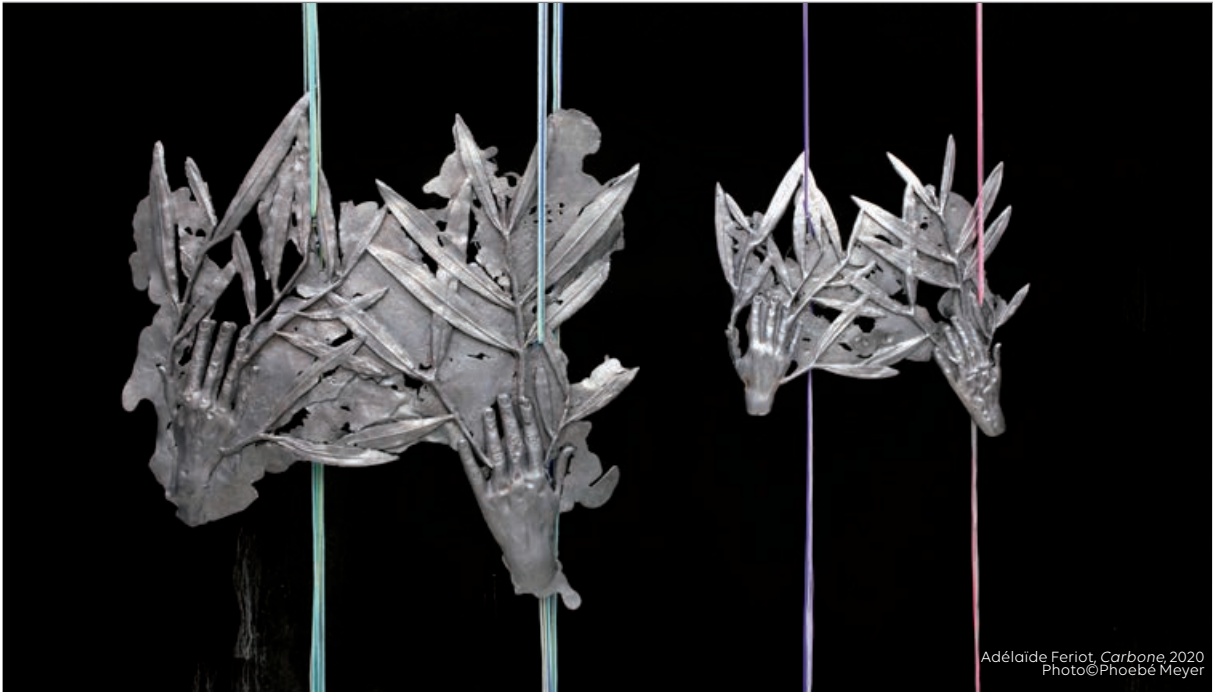
Adélaïde Fériot, Carbone , 2020